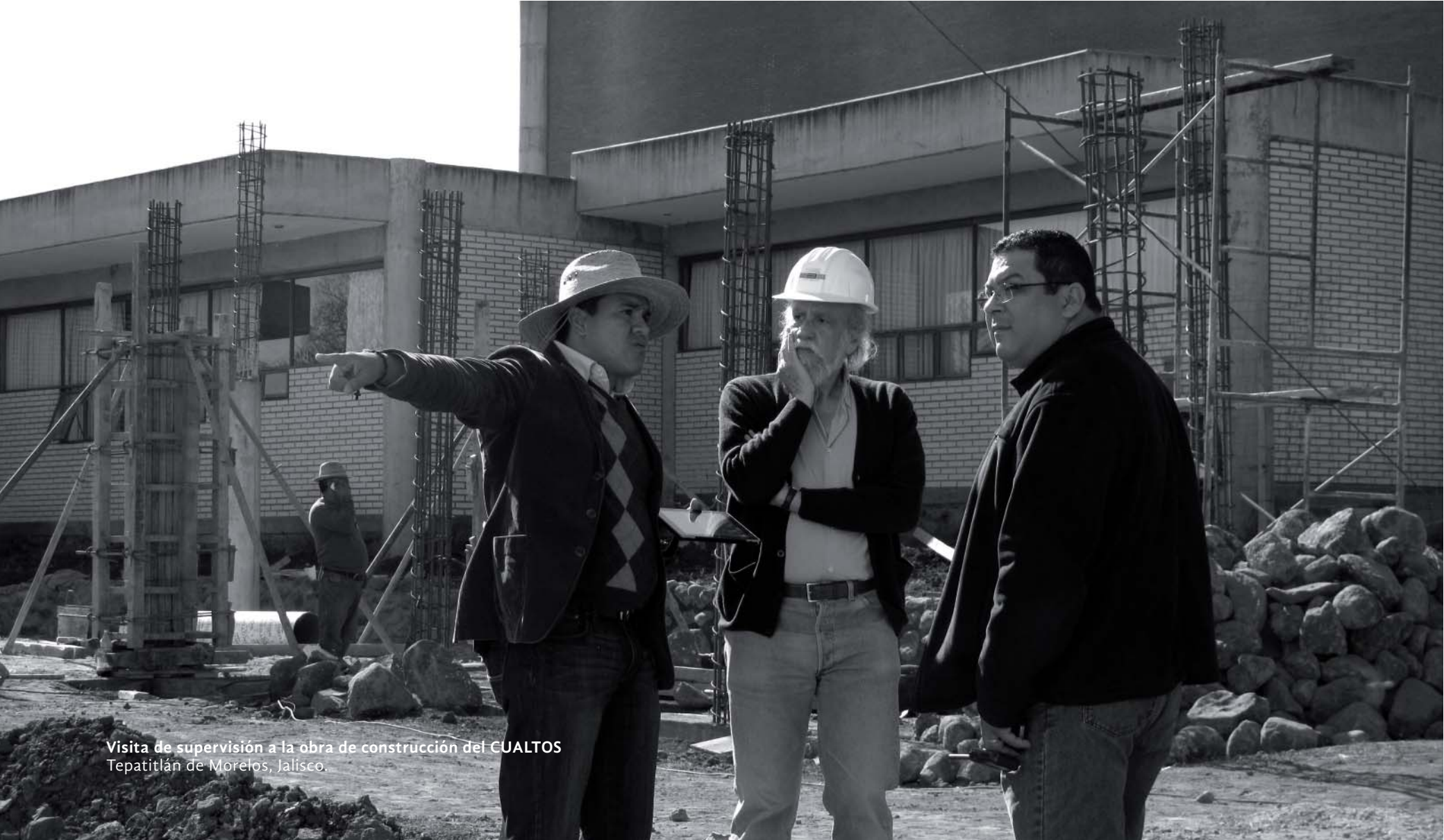
Visita de supervisión a la obra de construcción del CUALTOS Tepatitlán de Morelos, Jalisco.