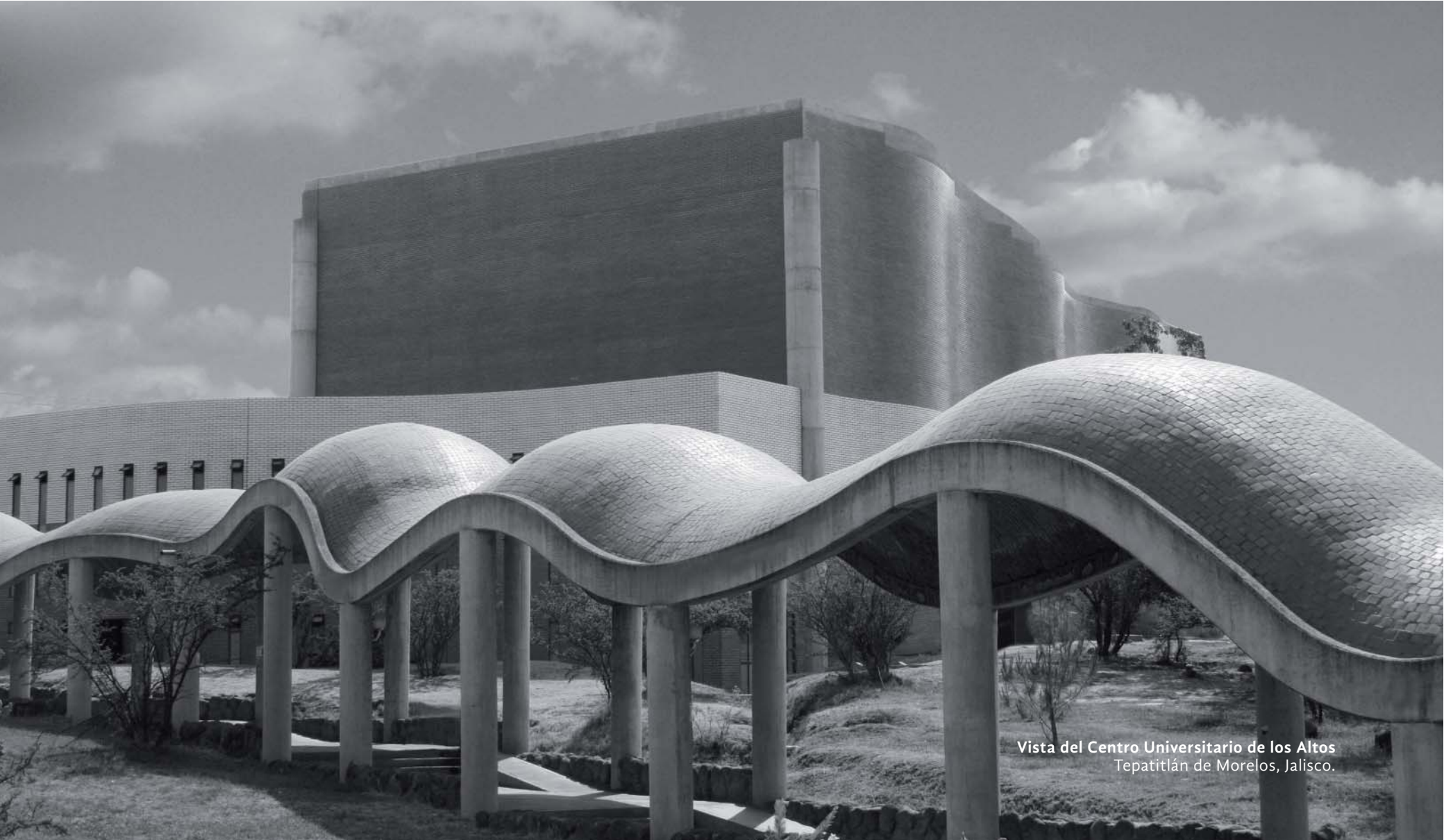
Vista del Centro Universitario de los Altos Tepatlán de Morelos, Jalisco.