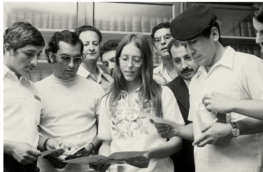
Figura 3 y 4: Michelle Bachelet, quien pasó algún tiempo en cárceles chilenas, muestra fotografías de seis compañeros chilenos tomadas por su padre en Santiago, en una conferencia de prensa celebrada en la oficina del Sindicato de Trabajadores Metalúrgicos Amalgamados en Surry Hills, el 12 de marzo de 1975 (Australia).

Producto del Golpe Militar, Michelle Bachelet viajó a Alemania donde continuó su formación de medicina en la Humboldt Universität de Berlín. Tras regresar al país en 1979, reanudó sus estudios, titulándose de médica cirujana en 1982.