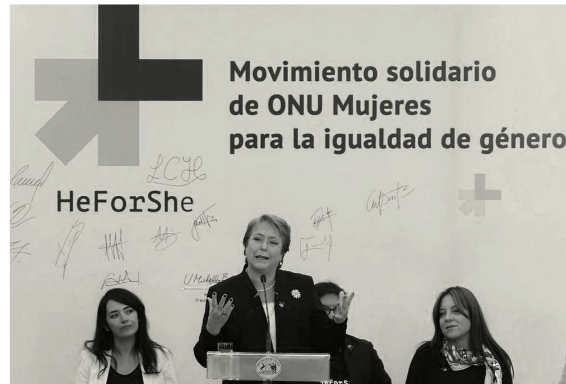
Figura 6: La presidenta de Chile, Michelle Bachelet, pronuncia un discurso durante la presentación de la campaña “He for She” 2016 de ONU Mujeres el 12 de abril de 2016 en Santiago de Chile.

El 15 de diciembre de 2013 se convierte, por segunda vez, en la Presidenta de la República de Chile para el período 2014-2018. Se reconoce que su gestión tuvo el sello de la “expansión y protección de derechos”, la realización de reformas estructurales orientadas a garantizar acceso a educación, mayor equidad de género y ampliación de cobertura, calidad de atención y protección financiera en el ámbito de la salud.