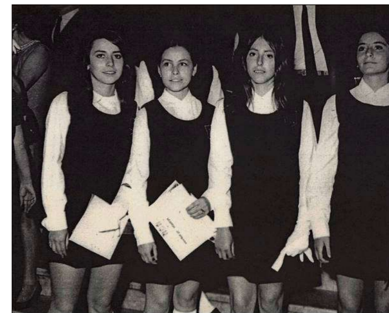
Figura 2: Michelle Bachelet (18 años) durante el día de graduación de la escuela secundaria (Santiago, Chile, 1969).